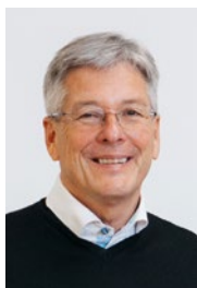
Dr. Peter Kaiser Landeshauptmann und Sportreferent