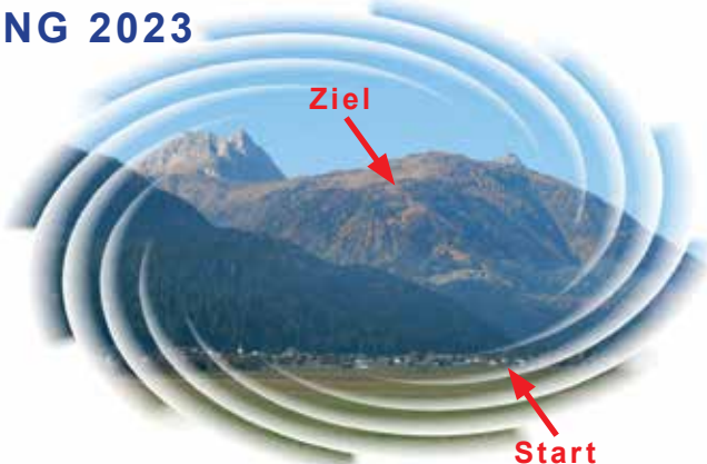
Streckenprofil "Mauthner Alm-Berglauf"