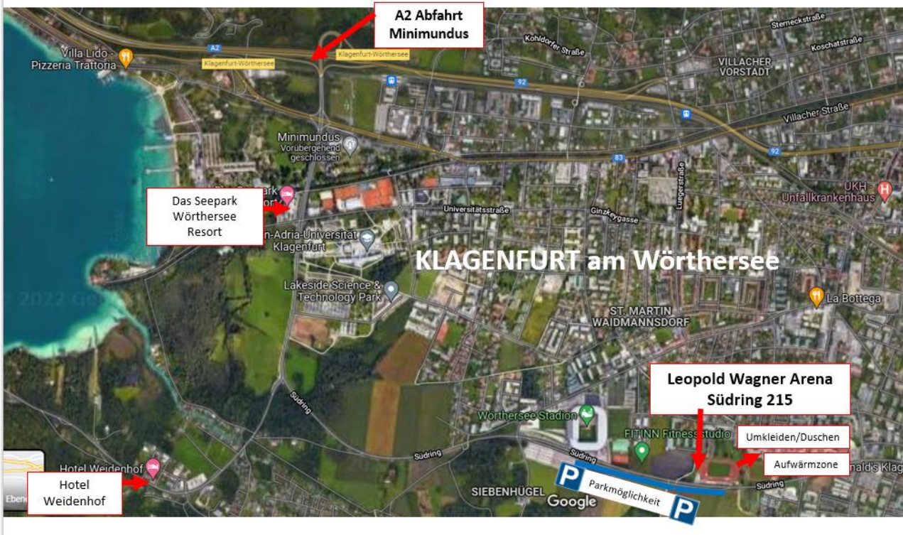
Übersichtsplan Leopold Wagner Arena