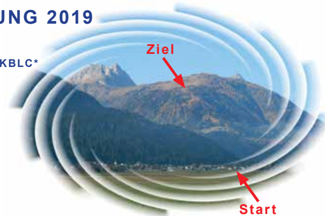
Streckenprofil "Mauthner Alm-Berglauf"