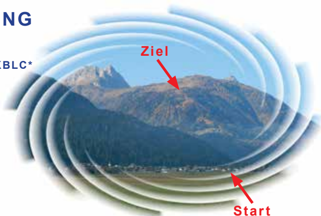
Streckenprofil "Mauthner Alm-Berglauf"